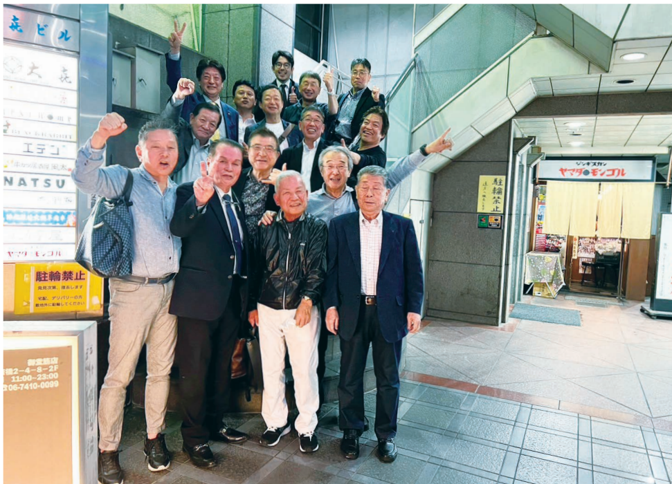
グルメ同好会 2024.04.26 ジンギスカン料理 ヤマダモンゴルにて