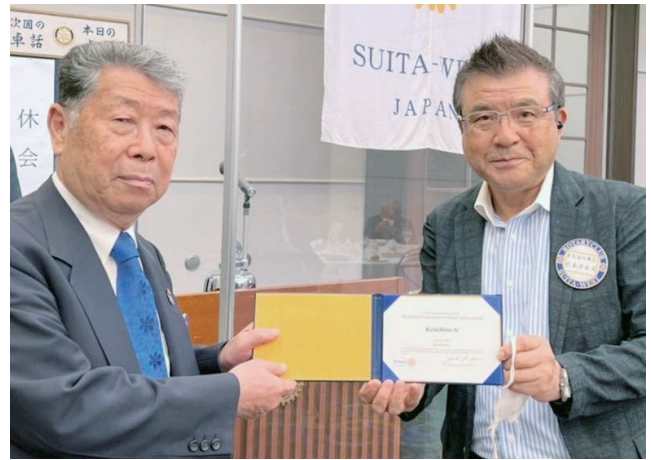
伊井パスト会長【ベネファクター認証状授与】