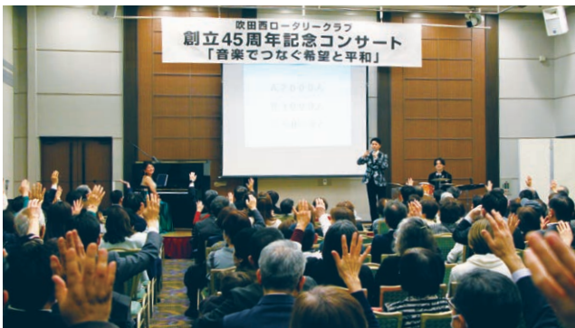
コンサート会場は満員御礼!