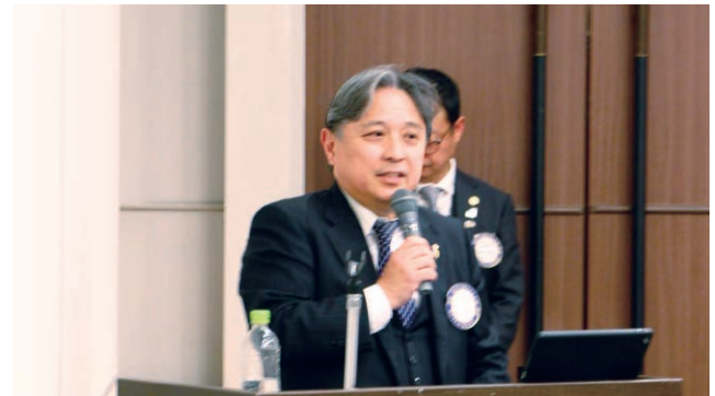
紙谷会長よりロータリークラブの説明とPR