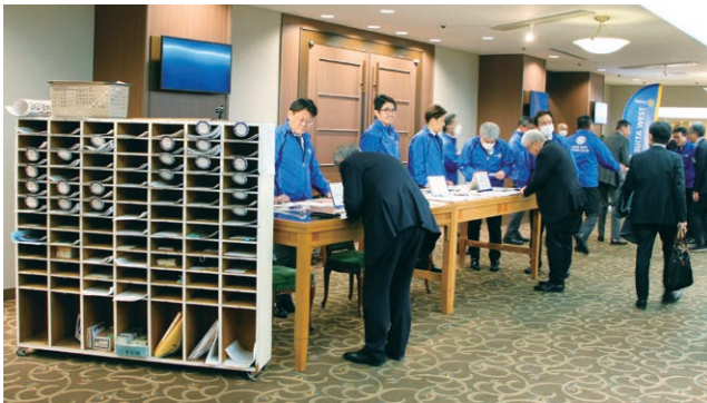
記念コンサートの受付風景、青がまぶしい