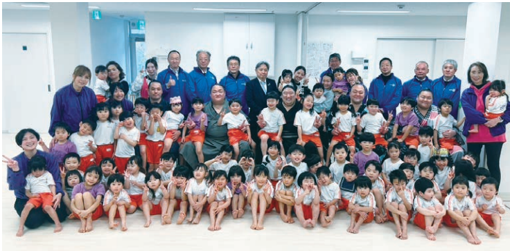
3月4日 木瀬部屋力士と遊ぶ in ちびっこランド江坂園