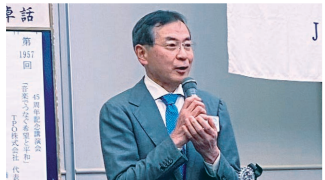
延原直前ガバナーよりお言葉を賜りました