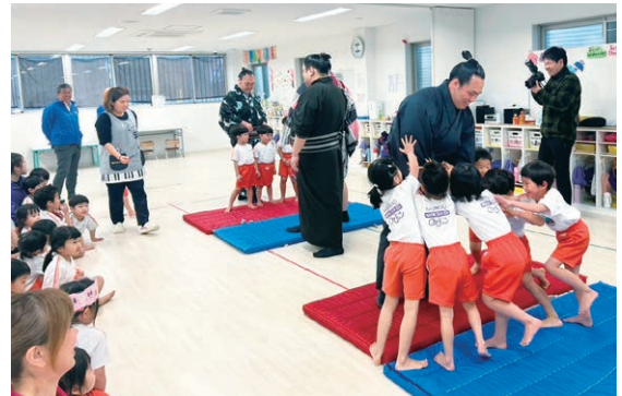
はっけよ〜い♪何人で押しても動きません