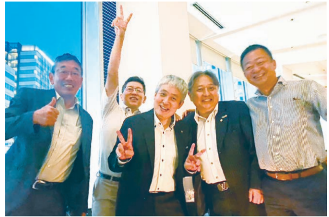
6月27日グルメ同好会の若人たち（笑）