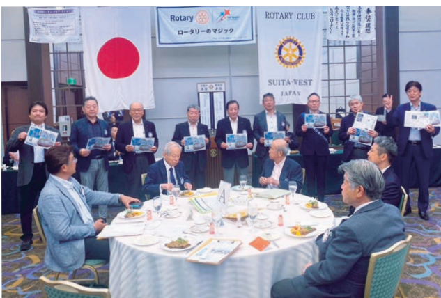
7月のお誕生日のお祝い