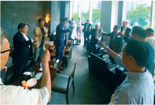
6月27日グルメ同好会 東梅田の「The BAR」にて