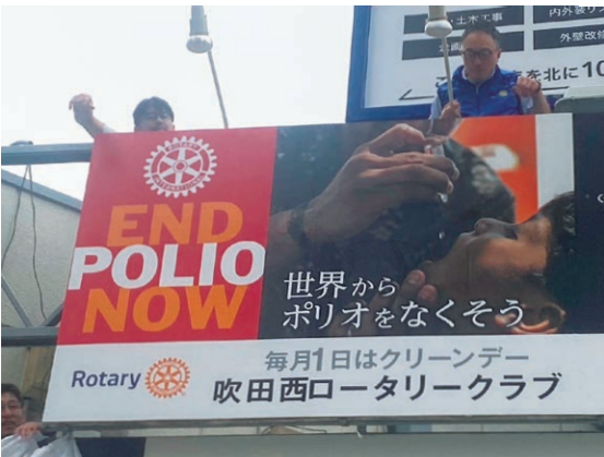
7月1日ポリオ撲滅看板をリニューアル