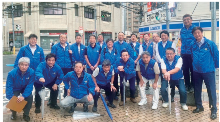
青の軍団 7月1日看板除幕式