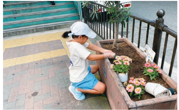
クリーンデー 協議会の活動もお手伝い