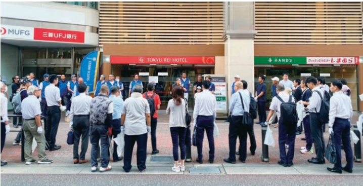
8月1日クリーンデー 江坂企業協議会もご参加