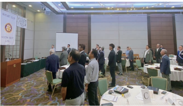
はじめに歌ありき、皆で合唱