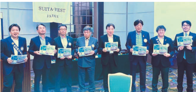
例会 8月のお誕生日のお祝い