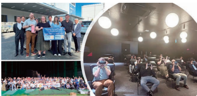
YPEアサヒビール工場・ダスキン工場・BBQ