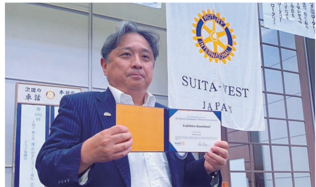
紙谷会長へ ロータリー財団ベネファクター襟ピンの贈呈