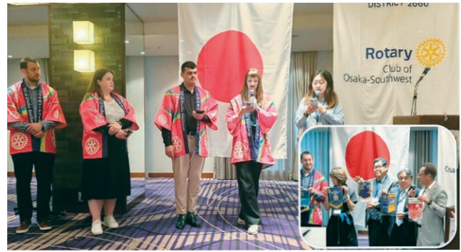
9月25日 リーガロイヤルにて4クラブ合同例会