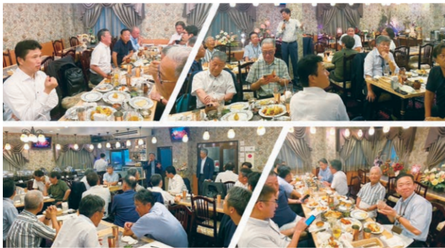
9月13日 青少年&社会奉仕炉辺談話