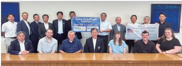
9月24日 YPEプログラム吹田市長訪問