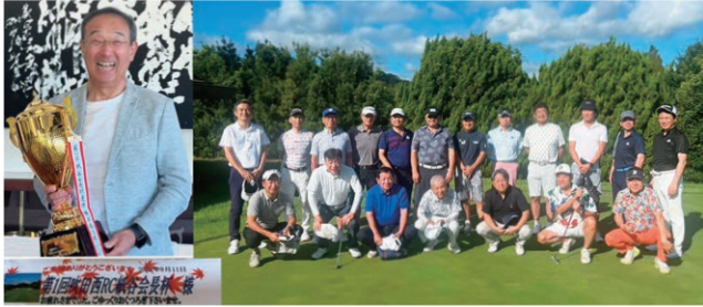
9月11日 第1回紙谷会長杯ゴルフコンペ