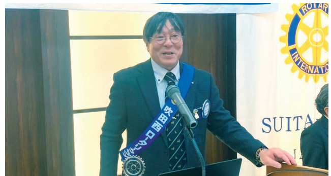
合田会員、卓話PPTの動作確認するように。