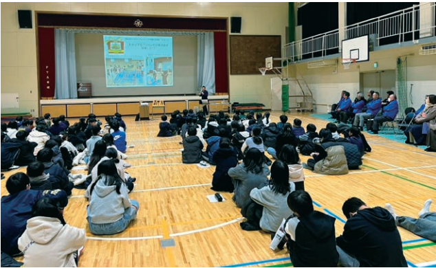
1月29日出前授業 in 豊津第一小学校