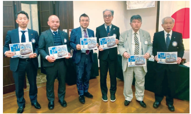
2月お誕生日の会員とご夫人の皆様、 おめでとうございます。