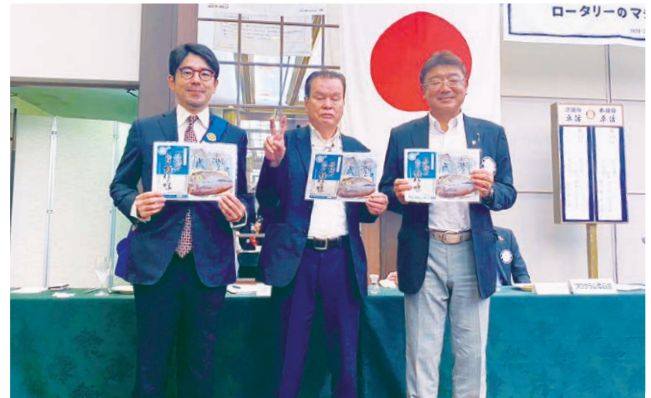
9月誕生日の皆様、おめでとうございます