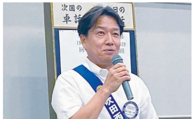
本日の卓話者 催事が続きます。ご自愛ください