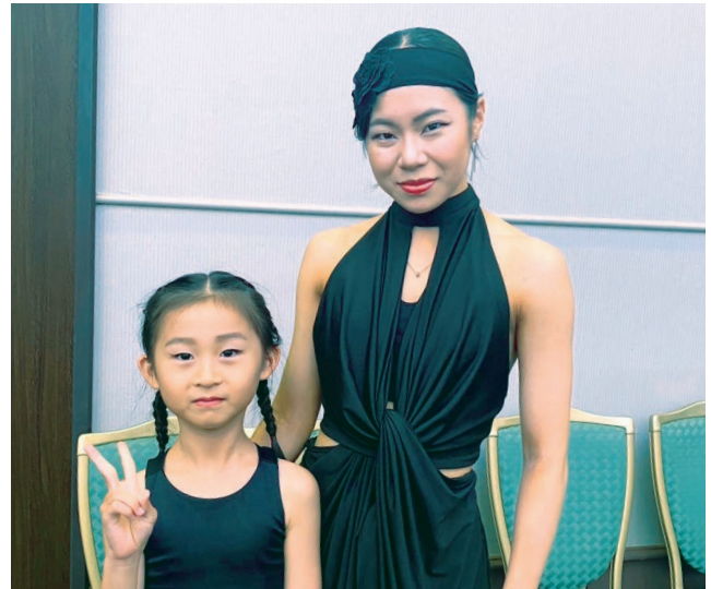
キレッキレの社交ダンスを披露してくれました

昨今、人も世も国も、他はどうあれ自分さえ良ければいいという風潮が目立ってきた。だからこそ、いま、人も世も共に ウェルビーイングを目指したい。