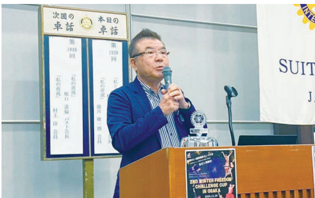
本日の卓話者 次は月に進出します