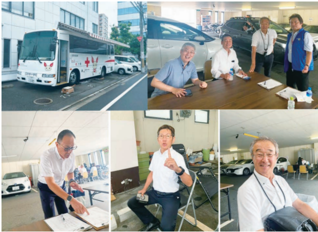
8月29日献血活動 血の気の多いメンバーです