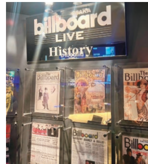
夏の移動家族例会会場