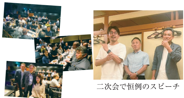
二次会で恒例のスピーチ

香り高い花があれば良い香りが身につくように、良い友人がいると知らぬ間に感化されて成長できる。