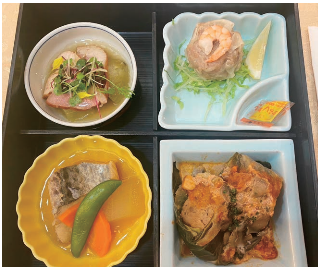
今日は和洋中の夕食です。旨い！