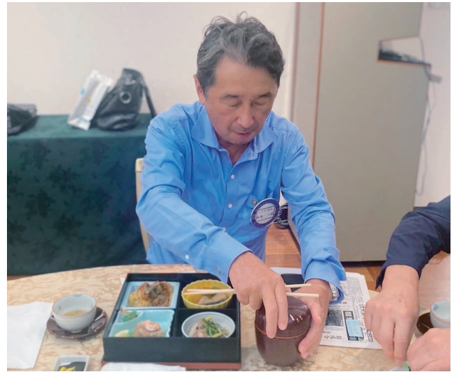
本日 8月26日が誕生日の坂本会員