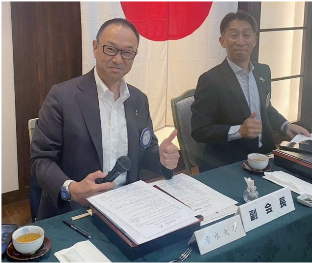
ふたりで例会を進行しています