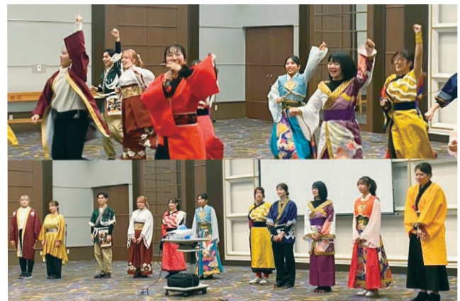
こいや祭り実行委員会の皆さんが新年例会を盛り上げてくれました。

本日のニコニコ箱 96,120円 累計のニコニコ箱 1,388,720円 累計のニコニコB 27,000円