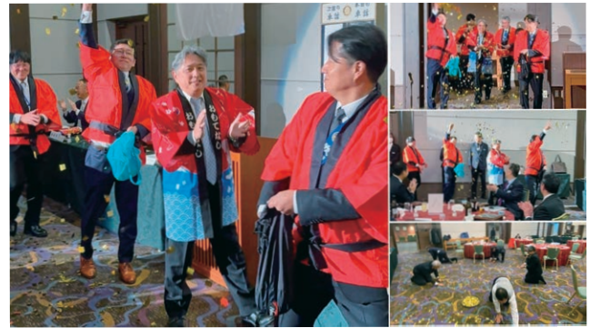
おめでと～ごぞいます♪会長登場！ 後片づけが大変でした。